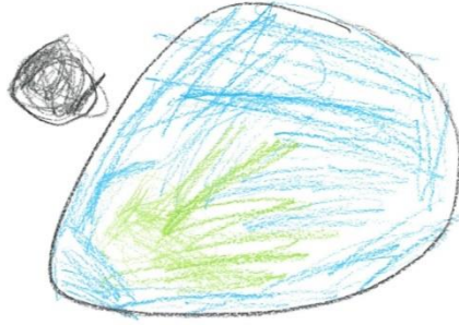
Regnbue, Frykt, Jorden